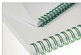
Reliure intégrale par anneaux métalliques