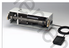
Faites évoluer votre machine avec le moteur de perforation électrique (en option)