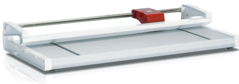
Table en aluminium anodisé