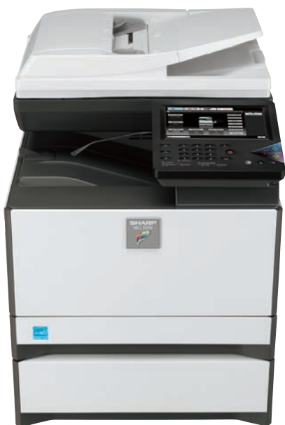
MXC301W avec l'option entrée papier